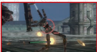
ダイレクト・ダメージ

戦闘で敵に与える、または敵から受けるダメージには2種類あります。相手のHPを直接なくす「ダイレクト・ダメージ」と、仮のダメージを与える「スクラッチ・ダメージ」です。これらは使用する武器によって変わります。なお、主人公たちが受けるダメージは、すべてスクラッチ・ダメージですが、デンジャー状態に陥った場合は、ダイレクト・ダメージに変わります。