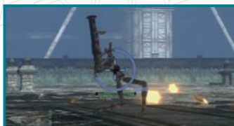
スクラッチ・ダメージ

大きなダメージを与えるが、スクラッチ・ダメージだけで敵を倒すことはできず、時間経過とともに回復してしまう。